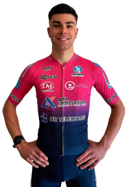
Equipement coureur 2024

L'exposition médiatique lors des courses et autres évènements cyclosporifs auxquels nous participons, peut aider à accroître la notoriété de votre marque. Vos logos seront affichés sur les maillots, les cuissards, les tenues des encadrants, les véhicules et d'autres supports matériels, atteignant ainsi un large public.